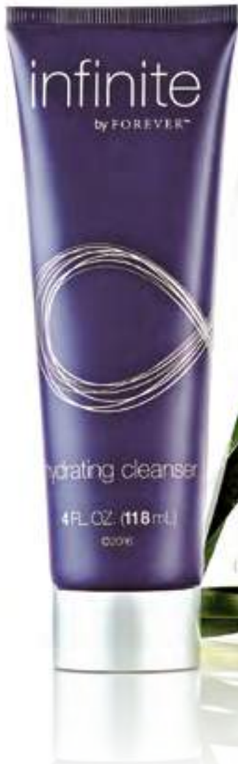
554 hydrating cleanser