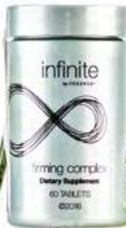
556 firming complex